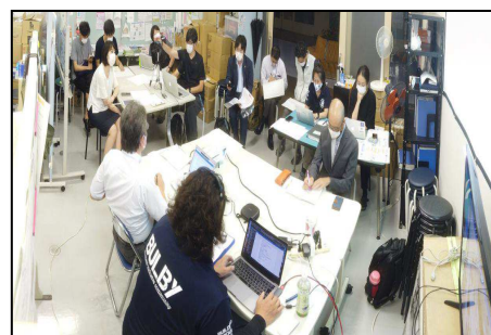
熊本県情報共有会議の様子

それには、泉区社協と災害ボランティア連絡会だけでなく、特に地域の関係機関・団体との協力のもと、その体制づくりが必要と言えます。【江尻】